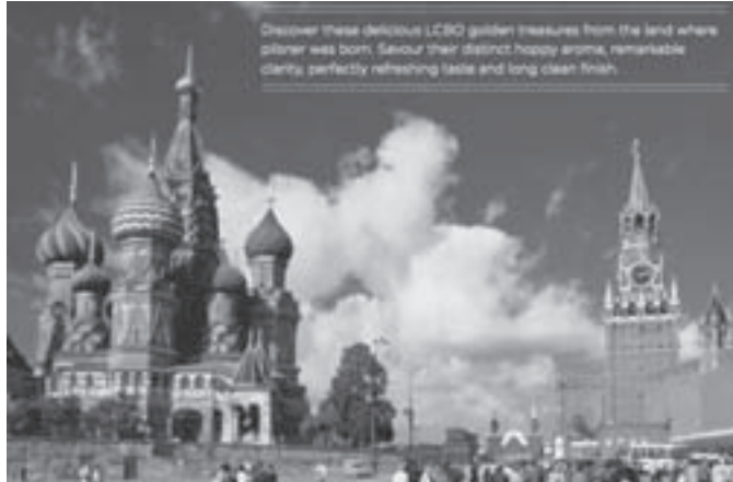
Discover these delicious LCBO golden treasures from the land where pilsner was born. Savour their distinct hoppy aroma, remarkable clarity, perfectly refreshing taste and long clean finish.

zeměpisně do východní Evropy (místo do střední či západní - obě by byly zeměpisně, kulturně i politicky korektnější), a nebo ho poslat do klína matky Rusi. V případě propagačního pamfletu LCBO se to povedlo hned natříkrát: česká piva jsou zařazena do sekce východní Evropy, která je uvedena výše zobrazenou fotografií Rudého náměstí v Moskvě s nadpisem: "Discover these delicious LCBO golden treasures